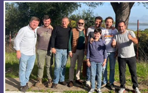
Los que no se pierden ni una. (Charanga)