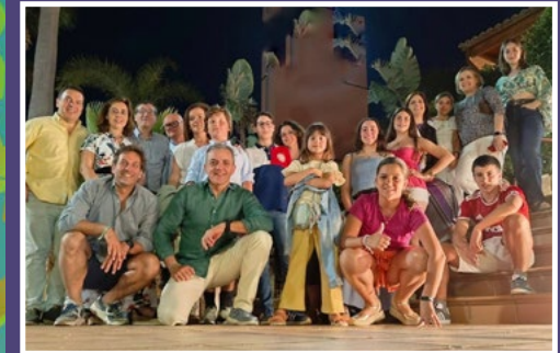
Los ABBAjaos. (Chirigota familiar)