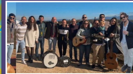
Los Piratas del Pantano. La maldición de Juan Sevillano. (Chirigota)