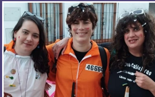
FALACIA (Formación de feministas LACIAS). (Recogía)