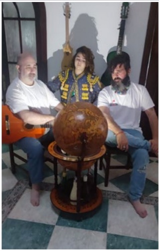
Comparsa los Correa. Entrevista con el vampiro (Comparsa)