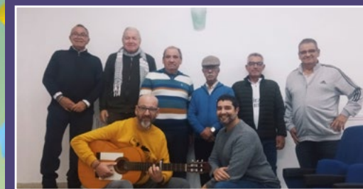
The Yuvinzes. (Chirigota)