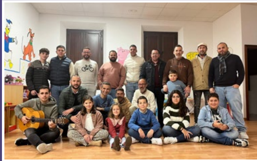
La Chirigota del Peral. (Chirigota)