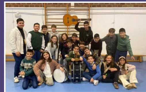
OsBornos. (Chirigota Infantil)