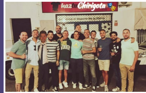
Los Tios Baranda Mamarrachos. (Chirigota)