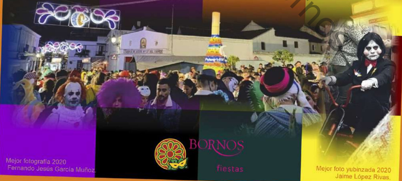
Mejor fotografía 2020 Fernando Jesús García Muñoz.