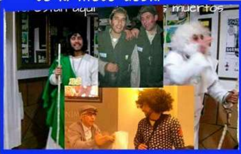
ROMANCERO "De profesión oscuro, te la meto doblá"