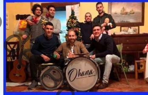
CHIRIGOTA "Los Barra Bravas"