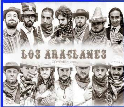
COMPARSA "Los Araclanes"