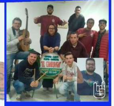
CHIRIGOTA "Las redes las carga el diablo"