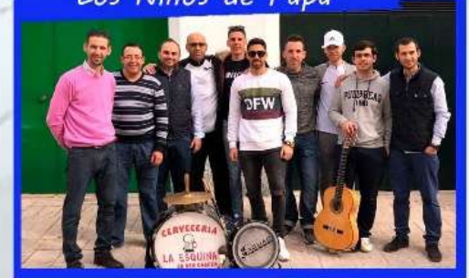
CHIRIGOTA "Los Niños de Papá"