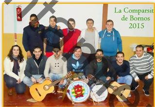
LA COMPARSITA DE BORNOS "EMBRUJO CALLEJERO"