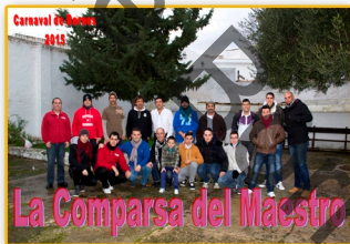
LA COMPARSA DEL MAESTRO